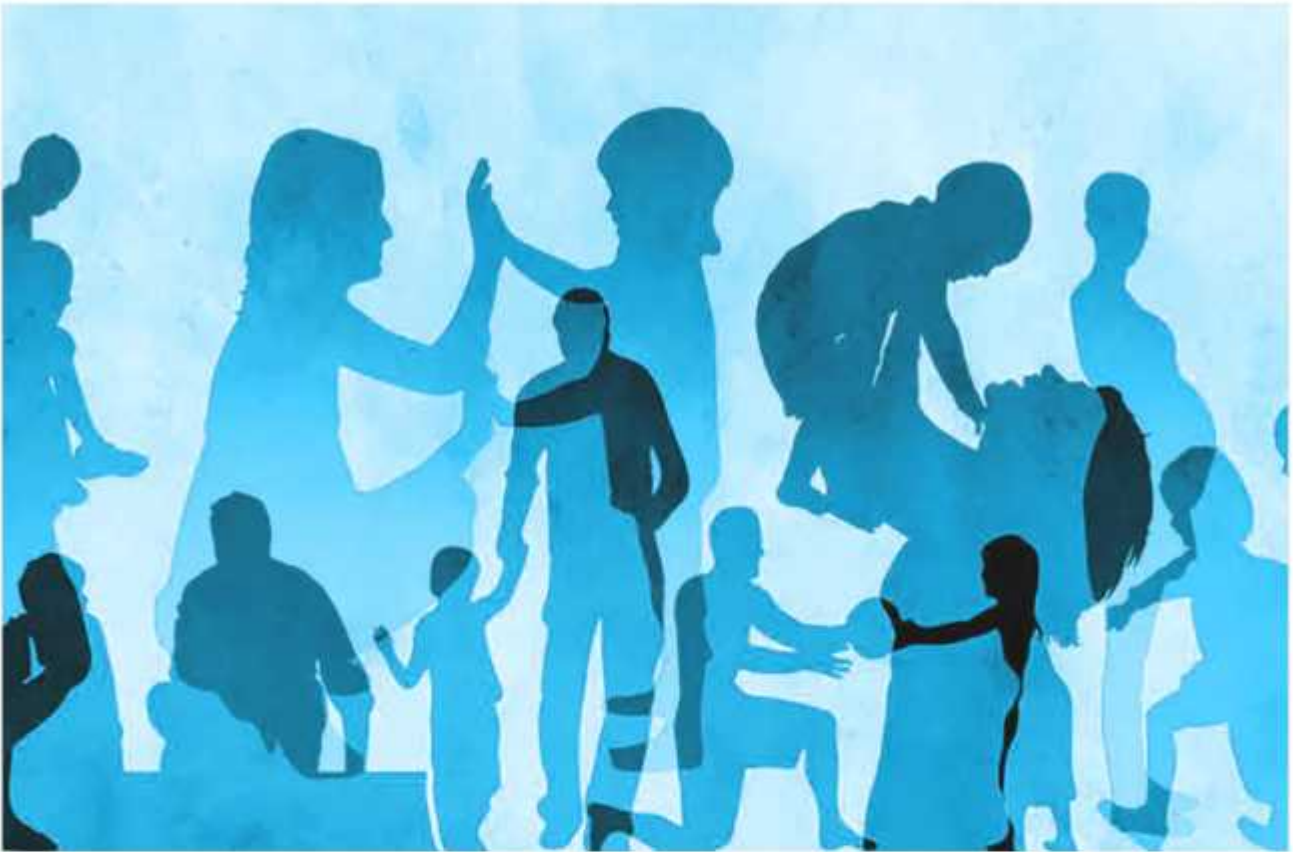
سایه بان آرامش | عوامل مؤثر بر انسجام خانواده

▲ انسجام خانوادگی به چه معنا است و چه عواملی در آن مؤثر است؟