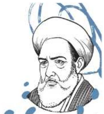
ابونصر محمد بن محمد فارابی