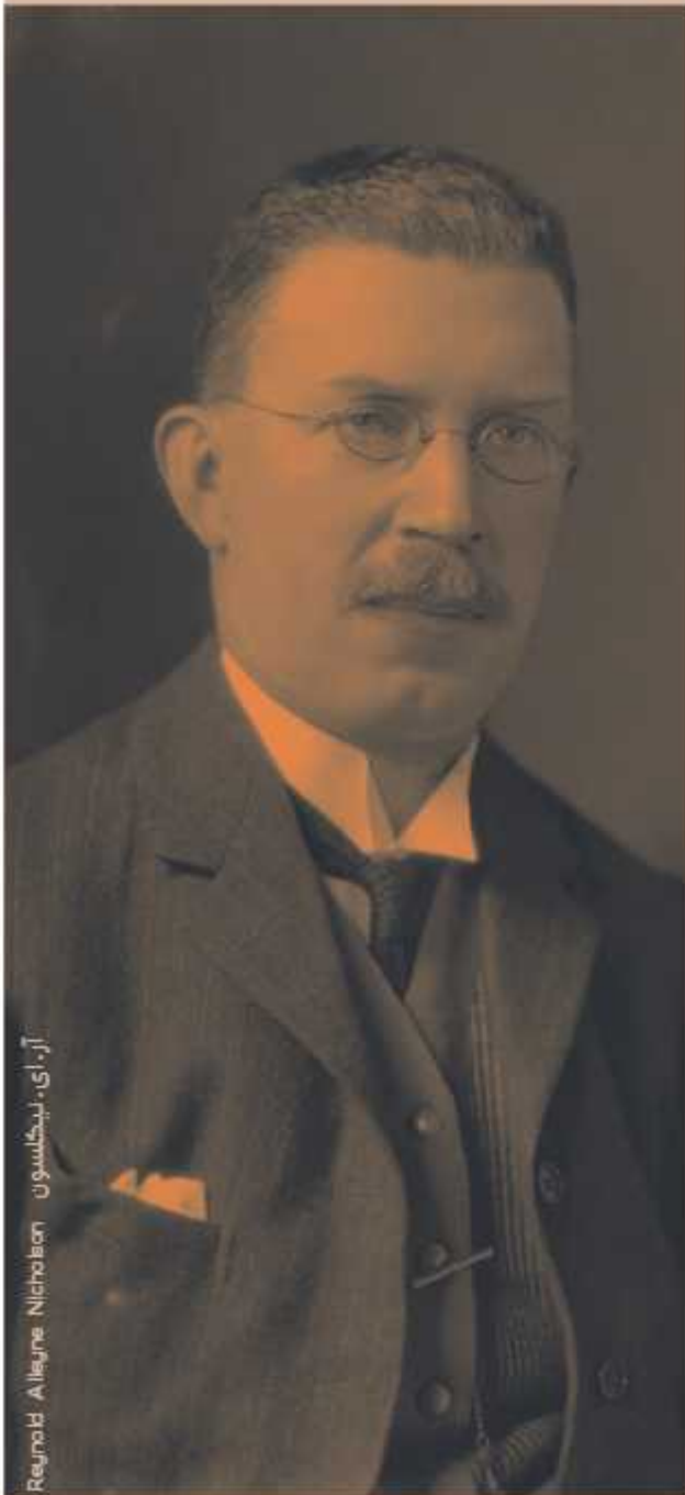
آر.آی. نیکلسون Reynold Alleyne Nicholson

امروزه علاوه بر دانشگاه لندن که مطالعات ایرانی را در متن مطالعات خاورمیانه‌ای انجام می‌دهد، در دانشگاه‌های ادینبورو، سنت آندروز، منچستر، آکسفورد، کمبریج، اگسیترو، دورهام و چند مرکز دیگر دوره‌های زبان، ادبیات و تاریخ ایران تا مقطع دکتری ارائه می‌شود. انجمن ایران (Iranian Society) از مراکز مهمی است که بی‌وقفه به فعالیت‌های ایران‌شناسی مشغول است. این مرکز در سال ۱۹۳۵ میلادی به ابتکار حسین علا در زمان سفارت او در لندن تأسیس شد و همیشه سفیر وقت ایران در لندن را رئیس افتخاری خود می‌داند. البته این انجمن بی‌اعتنا به توجه یا بی‌توجهی سفارت ایران در لندن، جلسات و نشست‌های منظمی در باب ایران‌شناسی ترتیب می‌دهد که در آن از مولانا گرفته تا قنات مورد بررسی قرار می‌گیرد. دیپلمات‌های انگلیسی شاغل در ایران، تجار انگلیسی شاغل در بازار ایران، ایرانیان مقیم انگلیس و بسیاری از افراد دیگر که به نوعی به ایران علاقه‌مندند، به این انجمن رقت و آمد دارند.