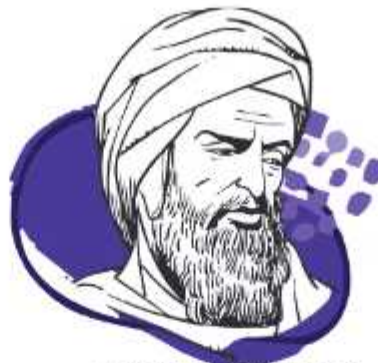
محمد بن احمد بن رشد اندلسی