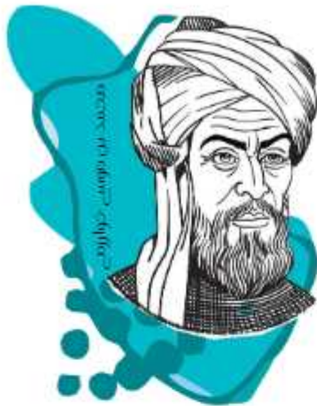
محمد بن موسیٰ خوارزمی